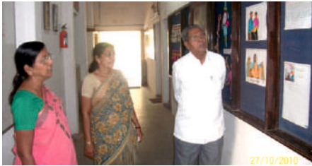
Shri K.J.Mehta College of Pre-Primary Education