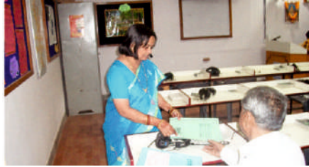
Shri C.K.Mehta College of Primary Education