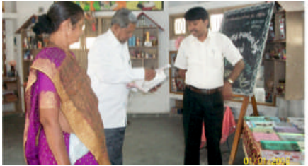
Shri Rajmani Primary School