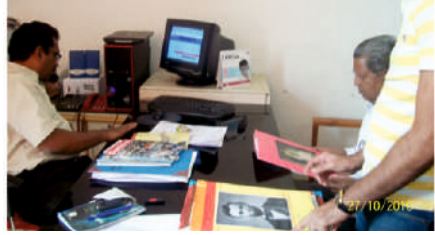
Smt. M. M. Mehta English Medium